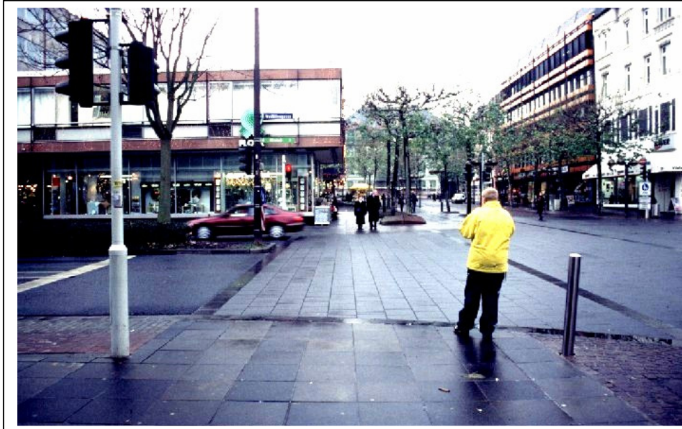
Abb. 4: Vierspurige Kreuzung in Mainz, die zwar von Rollstuhl- und Rollatornutzern optimal gequert werden kann, für blinde Menschen aber eine fast unüberwindliche Barriere darstellt.

Eine totale Niveaugleichheit größerer Verkehrsflächen, wie es Shared-Space-Projekte vorsehen, ist nicht neu. Dass Bordsteinkanten beseitigt und großzügig