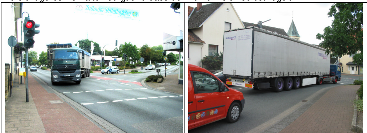
Abb. 1 – 2: Speziell in Bohmte erhofft man sich vom Shared-Space-Projekt u. a., dass der Durchgangsverkehr mit gegenwärtig mehr als 12000 Fahrzeugen pro Tag und hohem Schwerlastverkehr-Anteil die Gemeinde stärker meidet und weiträumig umfährt.

Zu diesem Zweck werden aus Straße, Gehweg, Innenhöfen, Gärten und Grünanlagen möglichst großflächige, einheitlich gepflasterte Platzsituationen geschaffen, die dann von allen Verkehrsteilnehmern gemeinsam genutzt werden können. Verkehrsschilder und Fußgängerinseln werden entfernt, Lichtsignalanlagen durch kreisverkehrähnliche Gestaltungen ersetzt. Erwartet wird, dass die dadurch bei den Verkehrsteilnehmern erzeugte Unsicherheit für ein rücksichtsvolleres und vorsichtigeres Verhalten sorgt und dass der Verkehr sich selbst regelt.